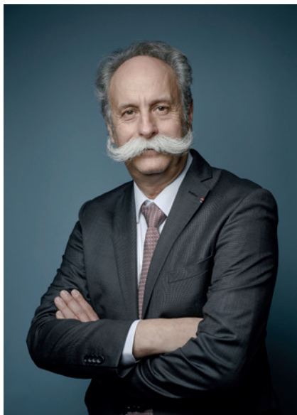
Bernard STALTER Président de l'Assemblée Permanente des chambres de métiers et de l'artisanat

Motion adoptée par l'Assemblée générale des chambres de métiers et de l'artisanat le 1 er février 2017